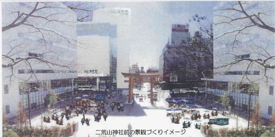
二荒山神社前の景観づくりイメージ