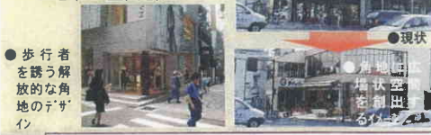
● 歩行者を誘う解放的な角地のデザイン