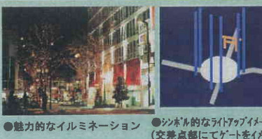
● 魅力的なイルミネーション ● シンボリックなライトアップイメージ (交差点部にてゲートをイメージさせる上方へのサーチライト)