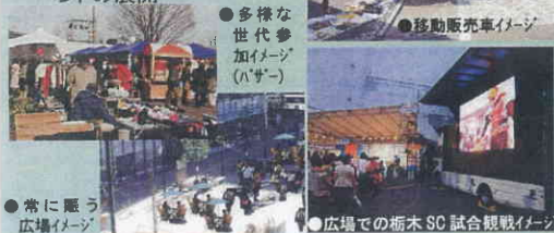
● 多様な世代参加イメージ (ハザー)