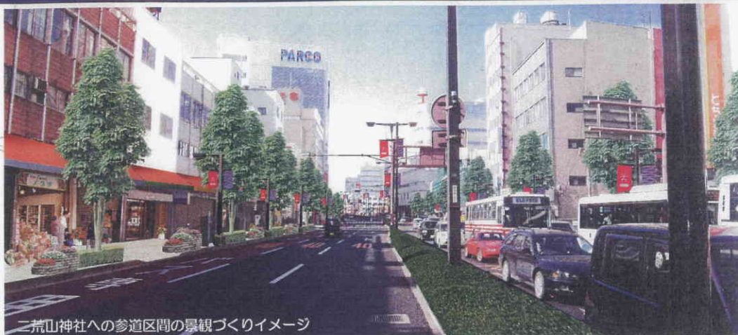
二荒山神社への参道区間の景観づくりイメージ