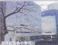
● 落ち着いたある色彩、屋外広告物の無掲示