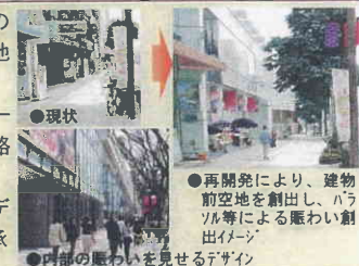
● 再開発により、建物前空地を創出し、バルコニー等による賑わい創出イメージ ● 内部の賑わいを見せるデザイン

◆ 再開発時の建物前空地の創出 ◆ 老朽アーケード代替、街路樹充実 ◆ 共同ビルのデザインの継承